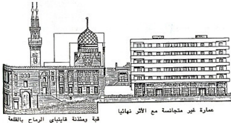
قبة ومعذنة قايتباي الرماح بالقلمة

وتمتلك مصر ذخيرة ضخمة من المباني والمناطق التاريخية التي تعد ثروة معمارية وحضارية بجانب كونها عنصر جذب سياحي وتنمية للاقتصاد القومي ، إلا أن معظم هذه المناطق تعرضت في الآونة الأخيرة لتغيرات اجتماعية وحضارية أدت إلى تدهور النسيج العمراني لذا يجب الوضع في الاعتبار أن القيم التراثية لها عائد مادي بجانب العائد الثقافي فيجب مراعاة إنجاز المشاريع الحديثة بحيث تتوافق مع البعد التاريخي والبيئي وتكون ذات كفاءة وظيفية مع تحقيق الطابع المعماري الجذاب المتوافق مع ما حولها من عمران وتاريخ.